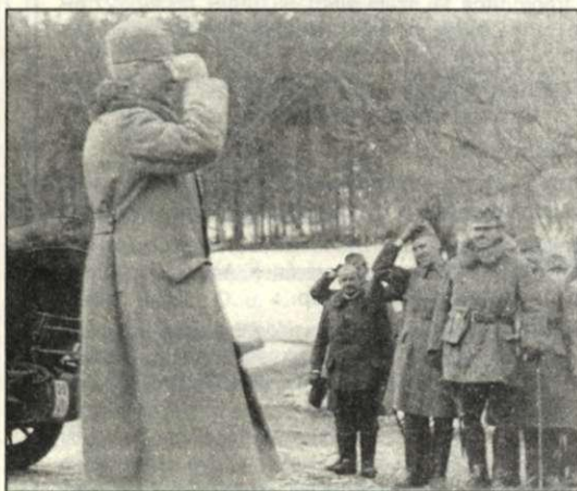
Harctéri életkép 101-es katonákkal

Az I. világháború 52 hónapos harcai után 1918 őszén tértek vissza. Majd ötezren maradtak szerette a véres harcmezőkön, köztük 500 csabai 101-es halt hősi halált és nyugszik jeltelen sírban távol, idegen földben.