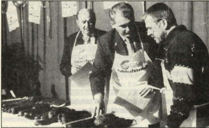
Minőségi ellenőrzés Pap- és Viczián-módra

Szeretné tudni, hogy készül az igazi csabai?