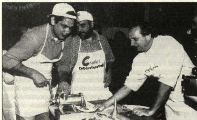
Készül a sportkolbász