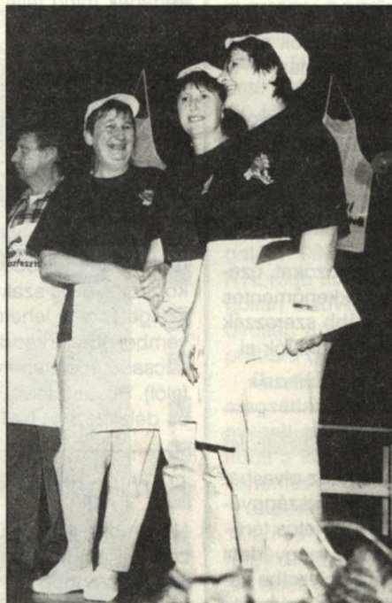
A kolbászkészítő verseny győztesei