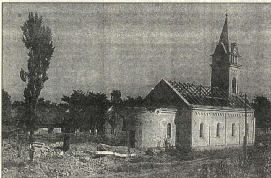
A lebombázott rendházépület már eltakarított romtöredéke és a megrongálódott templom korabeli felvételén