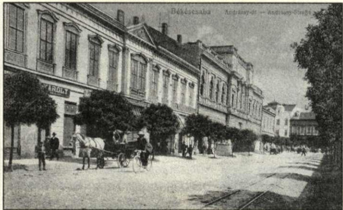
A csabai főutca korabeli hangulatát idéző látkép – a most 125 éves épülettel – 1910 táján

125 éve épült a Sztraka Ernő városi mérnök tervezte Vasút utcai bérház és községi járásbírósi épület. Itt kapott helyet az 1926-ban indult Fiú Felsőkereskedelmi Iskola. A jubileum alkalmából rendezett ünnepségen Békéscsaba Megyei Jogú Város Önkormányzata, a Békéscsabai Városvédő és Városszépítő Egyesület és a Széchenyi István Közgazdasági és Külkereskedelmi Szakközépiskola emléktáblát állított a műemlék iskolaépület udvarán.