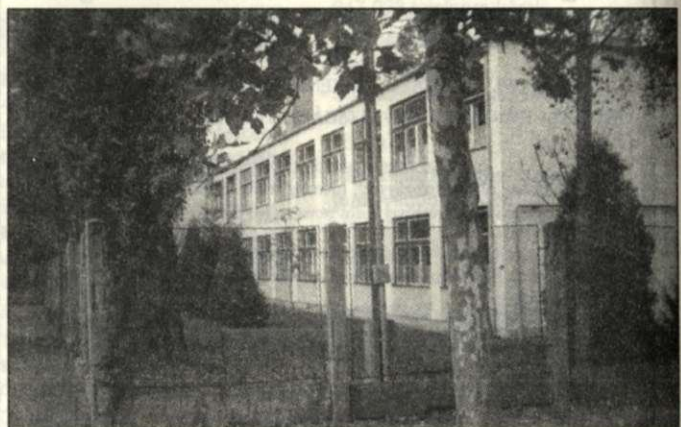
Az egykori kapucinusok temploma helyén felépült 11. Számú Általános Iskola épületrészlete