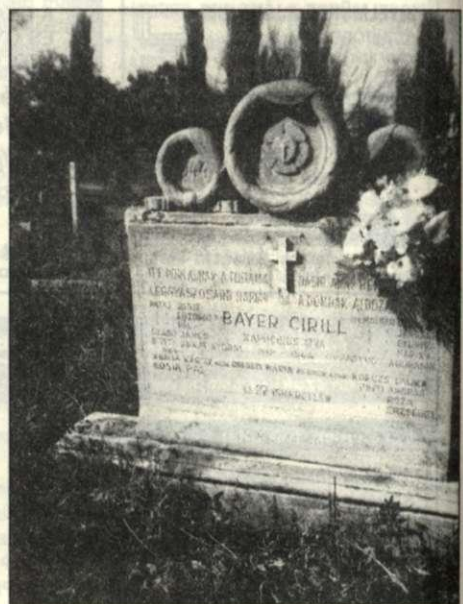
A légitámadás áldozatainak síremléke az evangélikus Alsóvégi (Vasúti) temetőben

A kapucinus rend csak később, 1938 augusztusában foglalta el a templom mögött épült plébániát és rendházat. Itt éltek a hosszú barna ruhát, hegyes kapucnit viselő hajadonfős, szakállas kapucinus barátok.