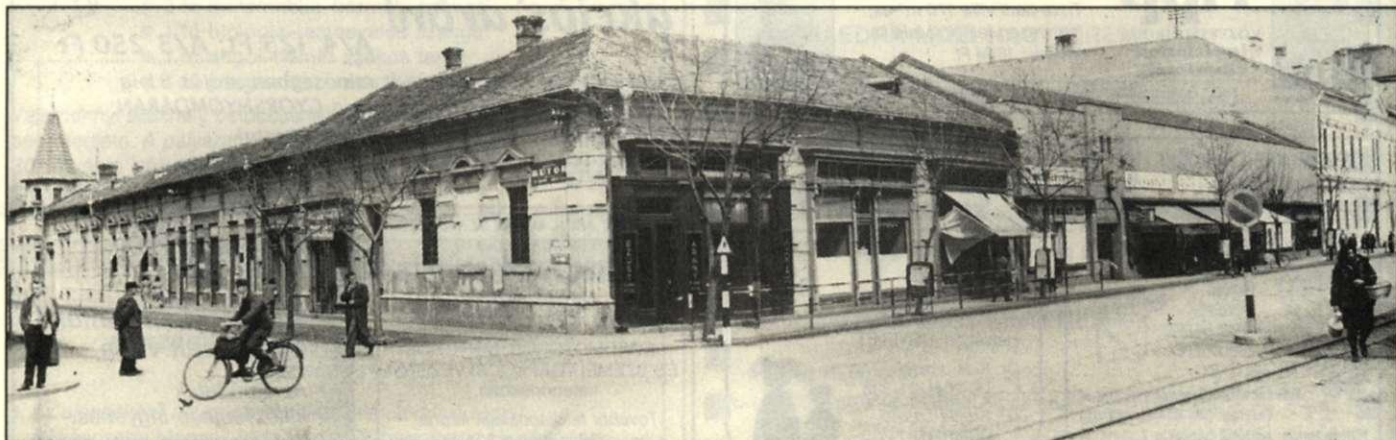
DANCÓ FERENC (GYŰJTÉS)