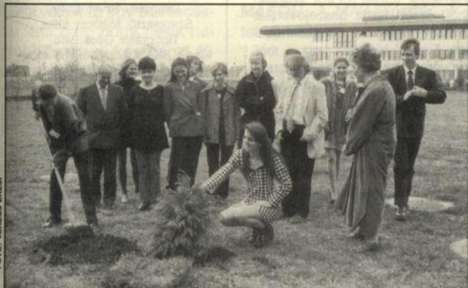
Faültetés a főiskola előtt – legyen béke