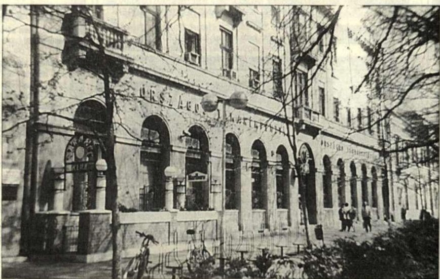
Az épület szép boltíves ablaksora