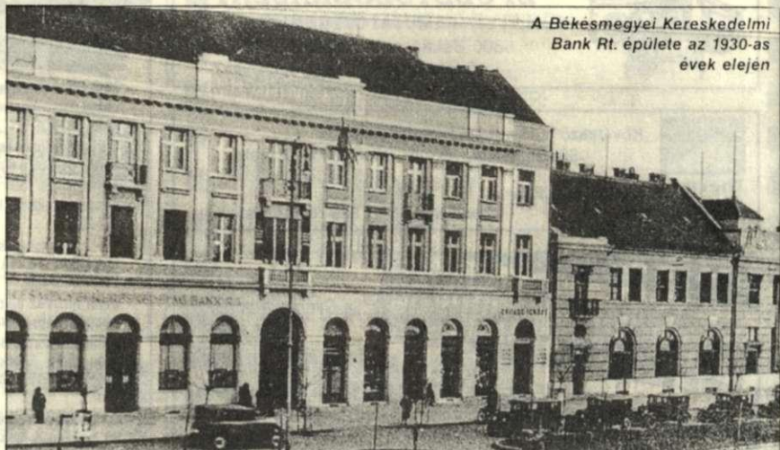
A Békés megyei Kereskedelmi Bank Rt. épülete az 1930-as évek elején

Az induló OTP intézte a lakosság pénzügyeit; átvette az ügyfél pénztét takarékbetétként való kezelés céljából, és különféle jellegű kölcsönöket folyósított. A kezdeti éveket követő, fokozatosan bő-