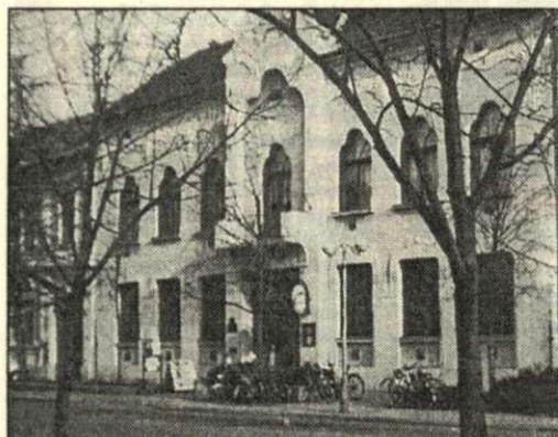
A bank első fiókja a Gazdasági Egyesület székházában