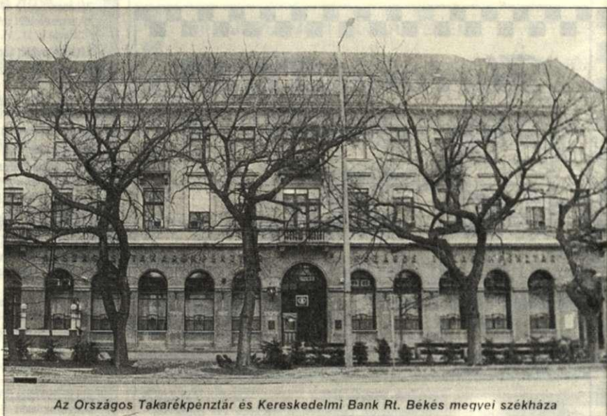
Az Országos Takarékpénztár és Kereskedelmi Bank Rt. Békés megyei székház