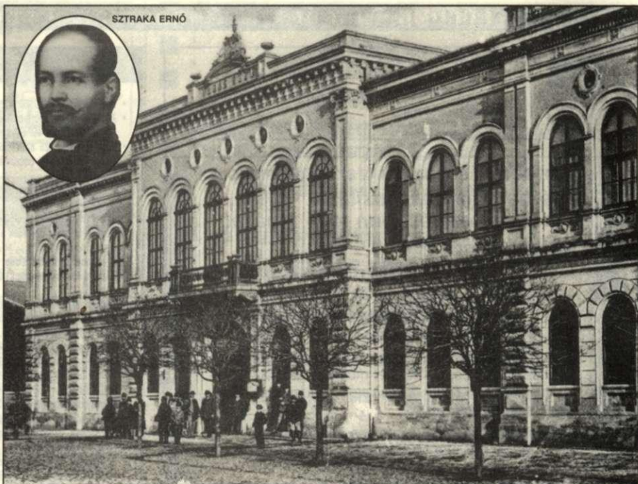
A romantikus stílusú városháza homlokzatát Ybl Miklós, az épületet Sztraka Ernő városi mérnök tervezte

1873. szeptember 15-én ünnepi közgyűlésen az összes csabai egyházak, a közbirtokosság és nagyszámú közönség jelenlétében avatták a városházát. Szemián Sámuel jegyző szép beszédében megemlékezett Csaba telepítéséről, az úrbéri válság nehéz időszakáról és a két éven át tartó, sok nehézség közepette zajló építkezésről.