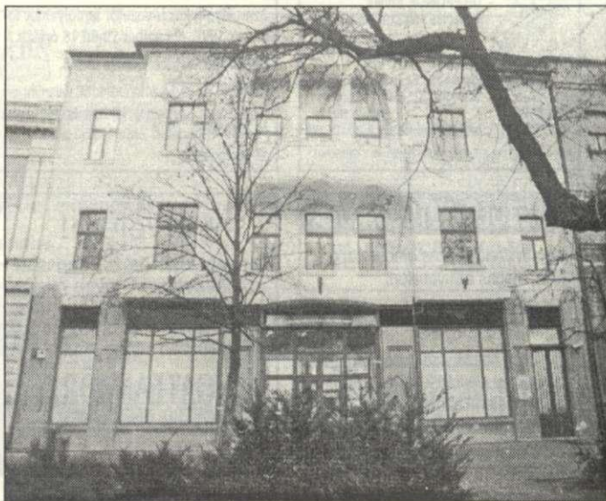
Az egykori banképületbe újból pénztézet, a most megnyílt Kereskedelmi és Hitelbank Rt. költözött