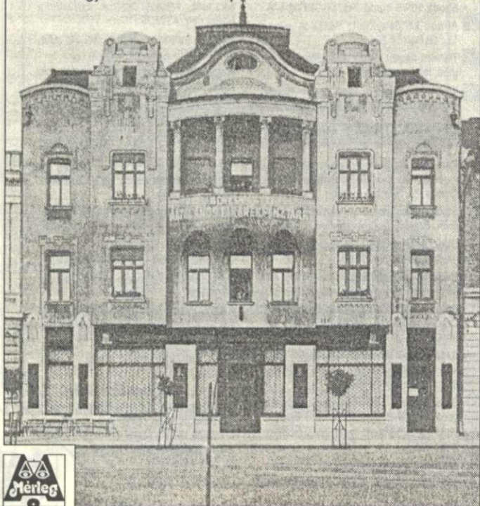
A Békésmegyei Általános Takarékpénztár Rt. székháza 1918-ban

Béla műépítész tervei szerint a földszint átépítésével újítottak fel. A modern követelményeknek megfelelő, impozáns berendezésű székházat és bankhelyiséget 1918-ban nyitották meg. A pénztézet még