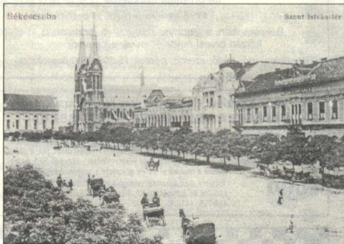
Főtéri életkép és a banképület a harmincas évek táján

ez évben érdekközösségbe lépett a Pesti Hazai Első Takarékpénztárral. A Békésmegyei Általános Takarékpénztár Rt. fiókhálózatokat létesített Eken, Endrődön, Gyomán, Medgyesegyházán, Tótkomlóson