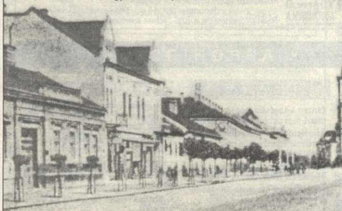
A ház, ahol a Békésmegyei Takarékpénztár Rt. volt 1910-ben (bal oldalt)