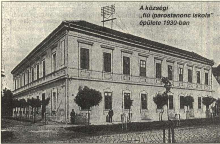
A községi „fiú iparostanonc iskola” épülete 1930-ban