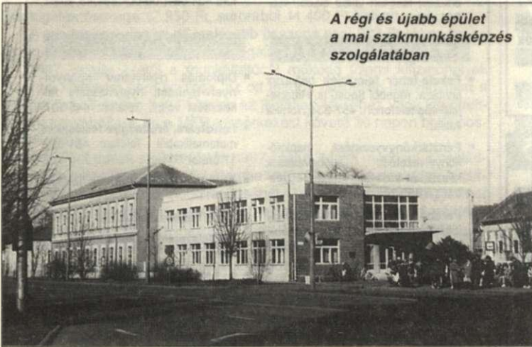
A régi és újabb épület a mai szakmunkásképzés szolgálatában