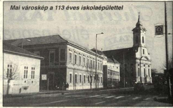
Mai városkép a 113 éves iskolaépülettel