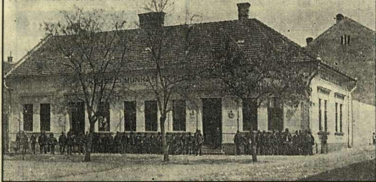
Munkára várók a csirkepiactéren a Községi Munkásközvetítő Hivatal és Munkásotthon előtt az 1910-es években