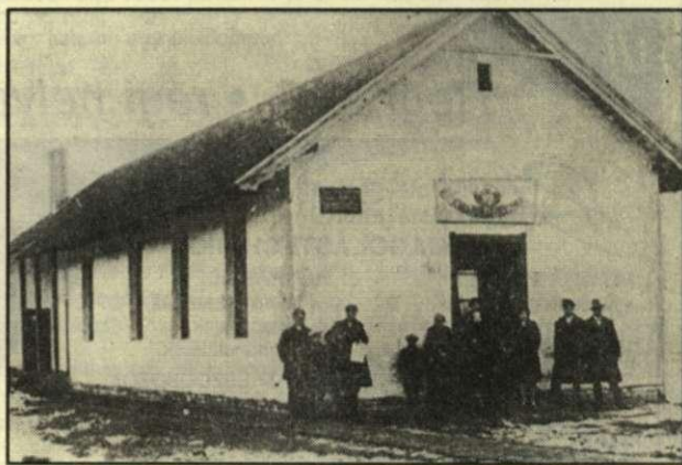
A Trefort utcai munkásotthon fotója a csendes avatáskor, 1923. november 30-án