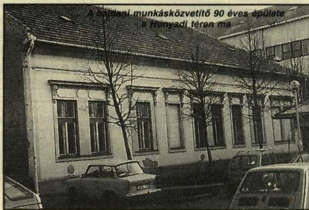
A hajdani munkásközvetítő 90 éves épülete a Hunyadi téren ma