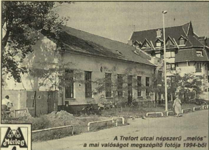
A Trefort utcai népszerű „melós” a mai valóságot megszépítő fotója 1994-ből