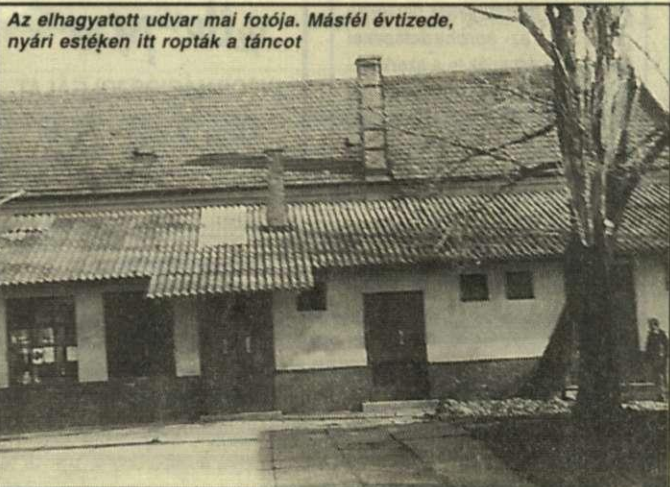
Az elhagyott udvar mai fotója. Másfél évtizede, nyári estéken itt ropták a táncot