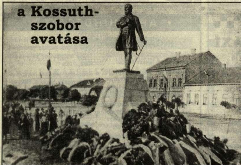
Koszorúk a Kossuth-szobor talapzatán az 1910. március 15-i ünnepség után