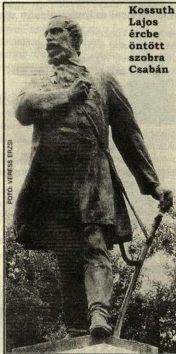
Kossuth Lajos ércbe öntött szobora Csabán

A szobor talapzatára letették azután az ünnepélyre hozott pompás koszorukat, számszerint mintegy