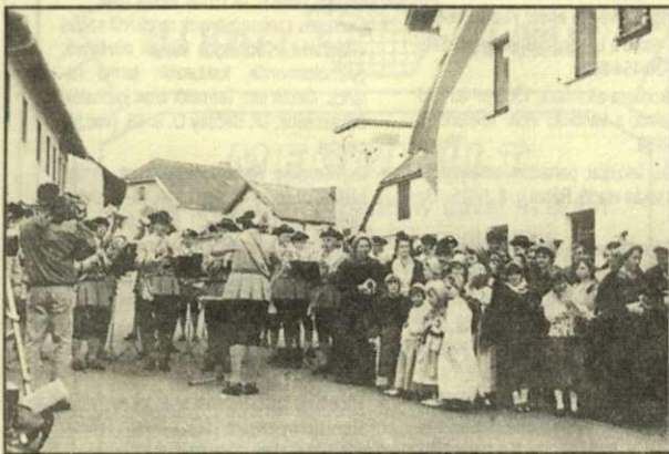
Az emléktábla-avató ünnepség résztvevői Harruckern szülőháza előtt május 20-án

Harruckern János György előbb a magyar bárói méltóságot, majd 1732-ben megkapta a főispáni címet. Bécsben, 78 éves korában halt meg és a Szent István Bazilika kriptájában nyugszik 253 esztendeje. Békéscsabán utca, a városházán emléktábla őrzi emlékét.