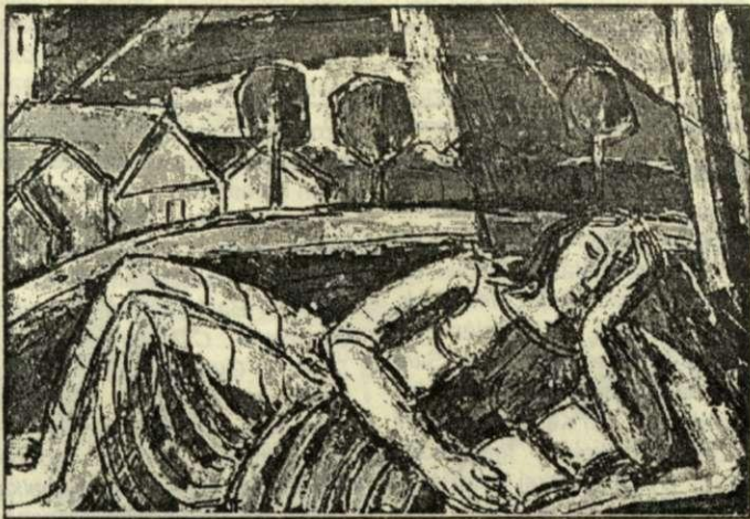
Olvasó lány tájban 61 x 82 cm olajfestmény, év nélkül

– A két hónap alatt 3000 olajképet sikerült nyilvántartásba venni, ezek közül a legtöbb vászonra, 600–800 pedig farosra készült; csak 130 volt kerettel ellátva, 90 százalékuknak nem volt címük. Találtunk 284 saját kerámiaszobrot, továbbá egy 143 darabból álló afrikai, mexikói és távol-keleti gyűjteményt, melynek egy része maszkokból áll, másik része különböző alakú figurákat ábrázol... Ezek alkotják a Jankay-hagyaték művészeti részét.