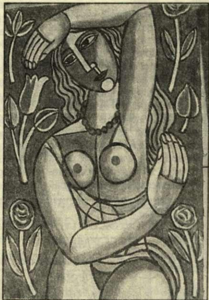
Lány tulipánnal és virágokkal 139 x 91 cm olaj, vászon 1990.