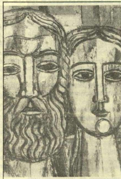
Öreg férfi, fiatal lány 82 x 61 cm olajfestmény, 1974.