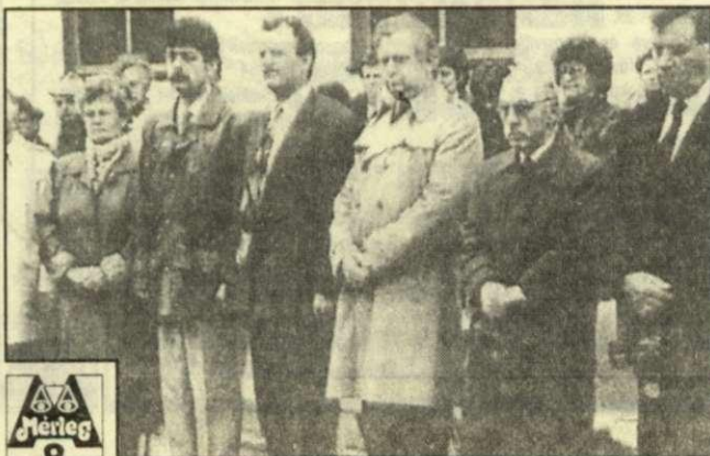
A Harruckern- emléktábla előtt Békés megye képviselői rótták le tiszteletüket