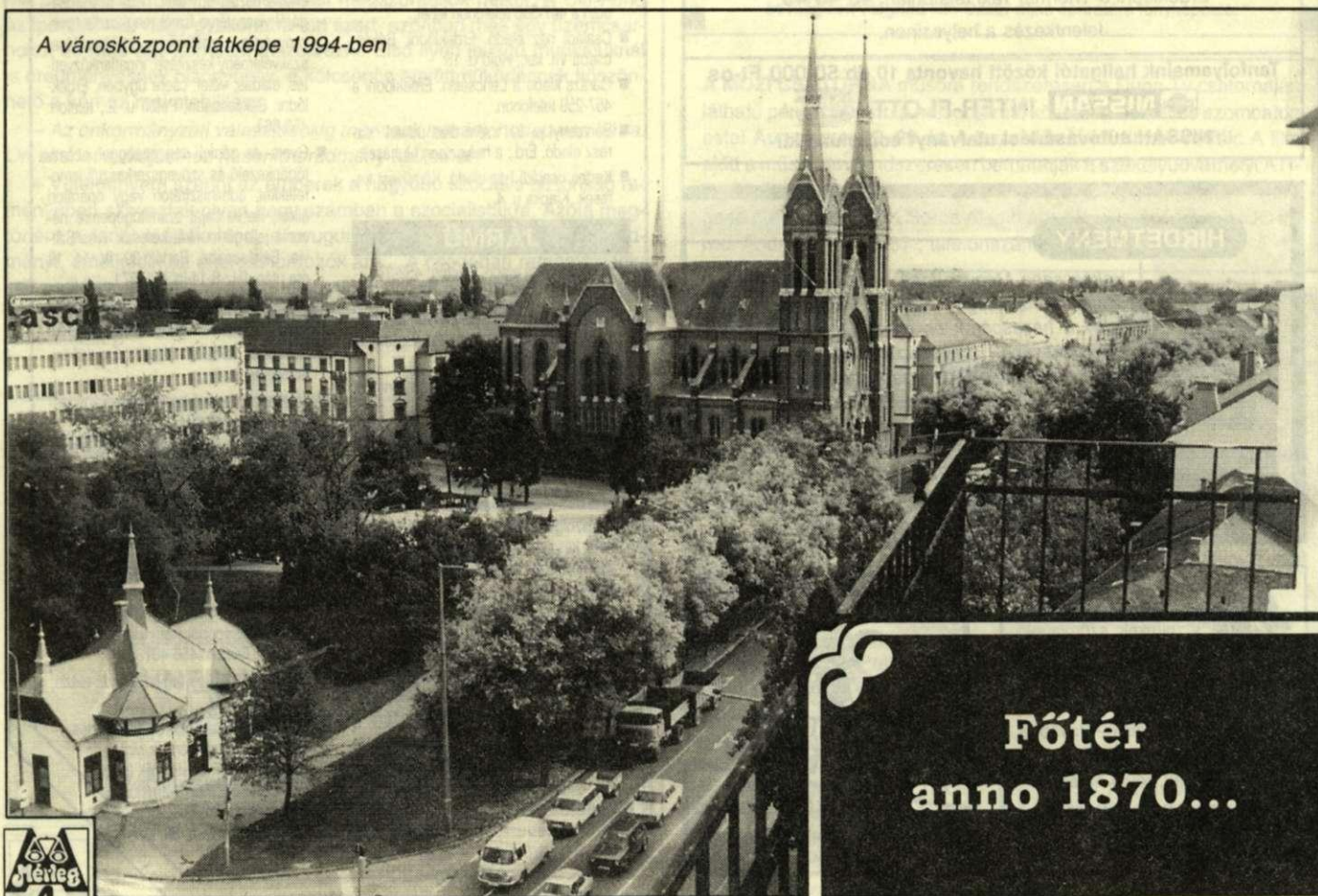
A városközpont látképe 1994-ben