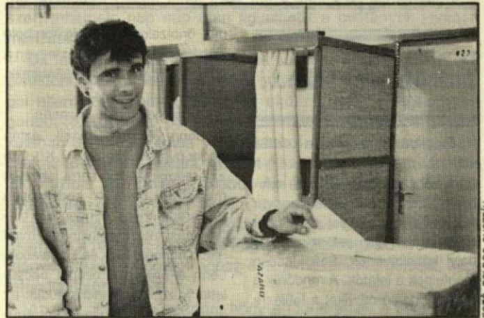
Na, kire szavaztam?

Az érvényes szavazatok megoszlása a következő: