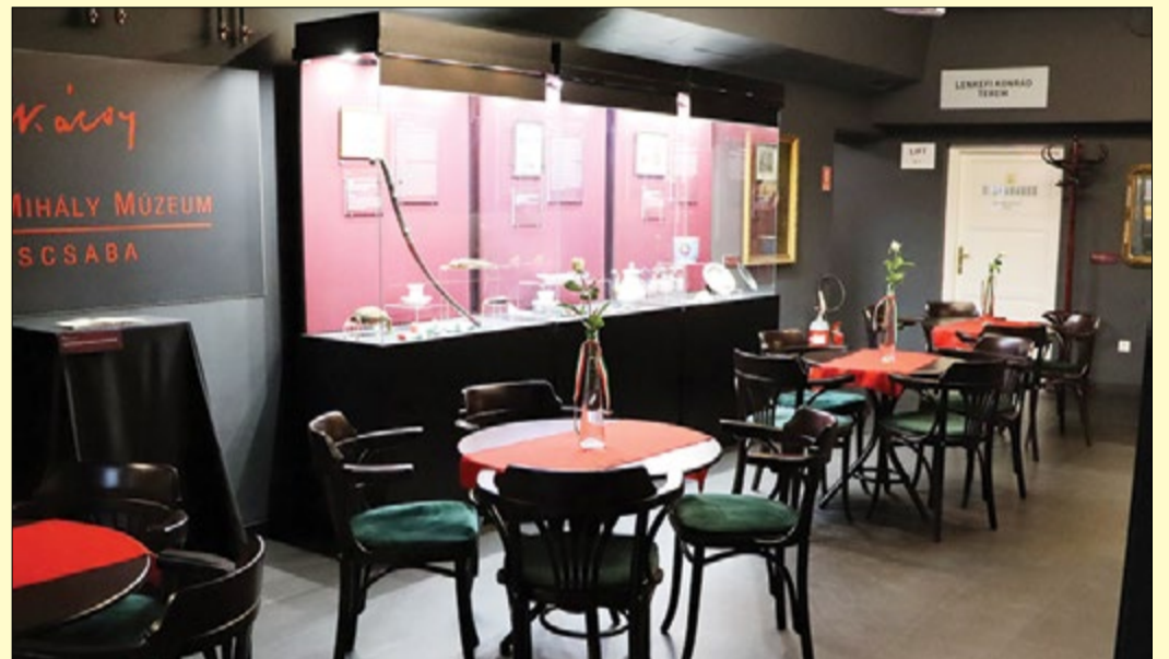
A kiállításon az egykori Pilvax kávéház hagyatékából láthatóak különböző tárgyak