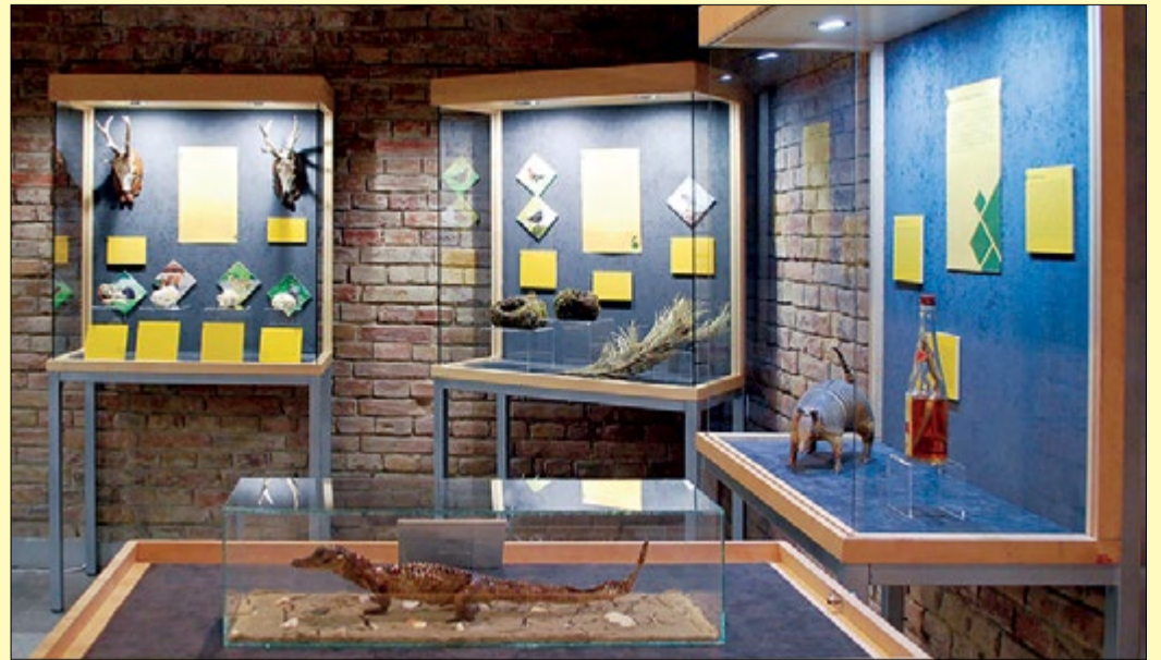
A „Mindig van új a nap alatt – A Munkácsy Mihály Múzeum új szerzeményei” című tárlaton számos érdekesség és sok újdonság látható

Sok különleges állatot látnak a televízió képernyőjén, de azért élőben látni egy olyan élőlényt, amely meszi földrészekben őshonos, mind a gyerekeknek, mind a felnőtteknek varázslatos élményt nyújt.