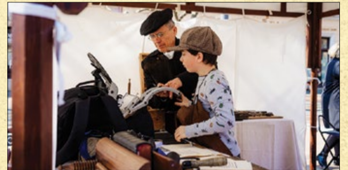
A Szent István téren lehetőség volt arra is, hogy a korabeli technikák segítségével nyomtassák ki a tizenkét pontot