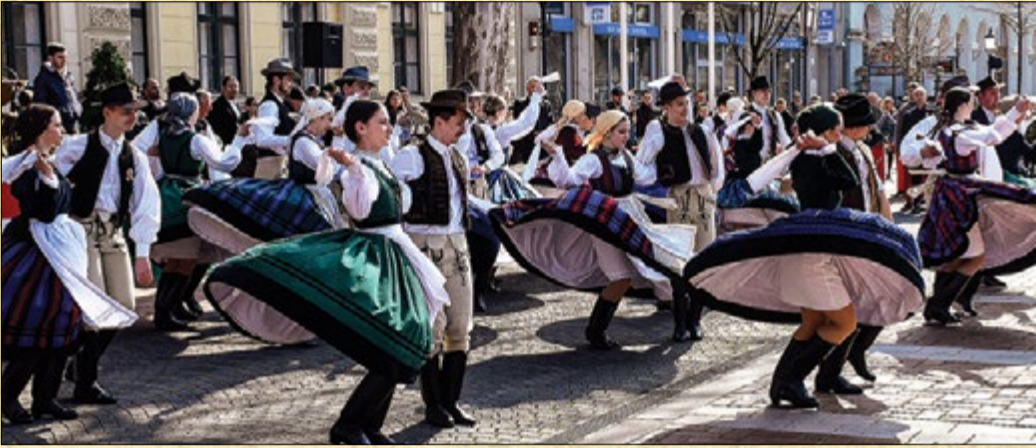
A rendezvény egyik leglátványosabb eleme az ünnepi díszmenet volt