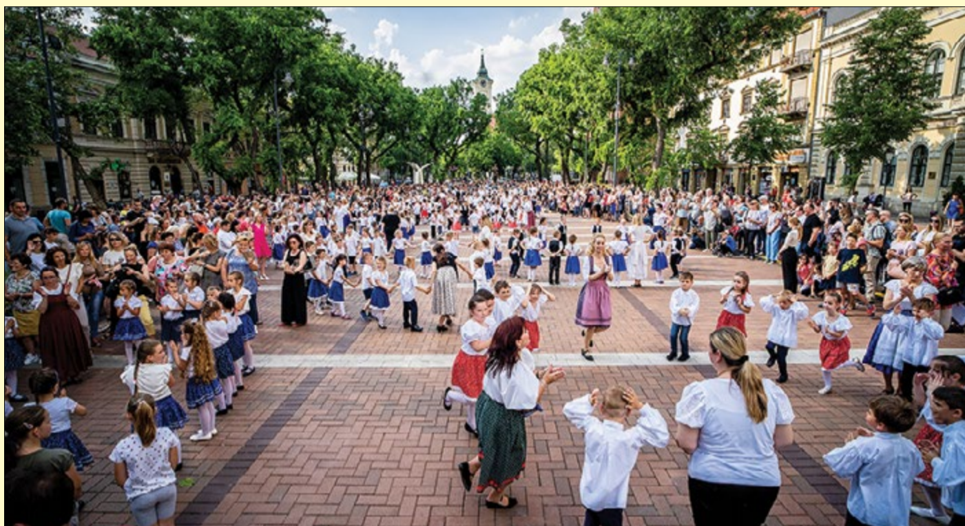
Békéscsaba 8 önkormányzati óvodája 18 telephelyen várja a gyerekeket – képünkön az aprók tánca a főtéren

A nemzeti köznevelésről szóló törvény hatályos rendelkezése szerint: a gyermeknek abban az évben, amelynek augusztus 31. napjáig a harmadik életévét betölti, a nevelési év kezdő napjától legalább napi négy órában óvodai foglalkozáson kell részt vennie. Ez a kötelezettség azokra a gyermekekre vonatkozik, akik 2021. szeptember 1. előtt születtek, és még nem járnak óvodába. Az óvodai felvétel jelentkezés alapján történik, a kitöltött és aláírt jelentkezési lapot a körzetes, vagy a választott óvoda e-mail címére kell elektronikusan elküldeni 2024. március 31-éig.