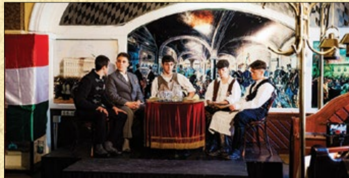
A Fiume Hotelben kialakított enteriőrben megidéztek az egykori Pilvax Kávéház hangulatát