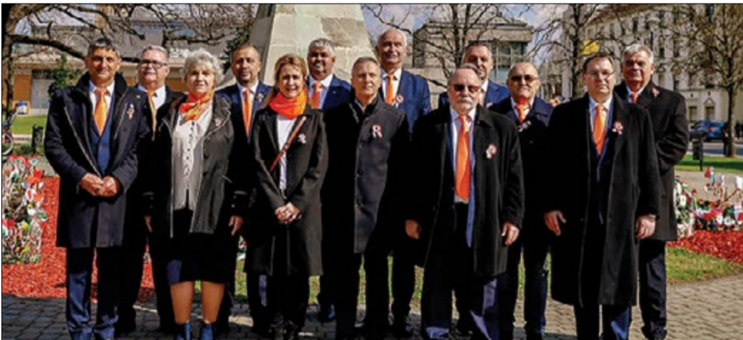
A Fidesz békéscsabai jelöltjei Herczeg Tamás országgyűlési képviselével

A Fidesz Békéscsabai Szervezet március 14-én ismertette azoknak a képviselőjelölteknek a névsorát, akik indulnak az idej önkormányzati választásokon. A pártnál döntöttek arról is, hogy nem állítanak önálló polgármester-jelöltet, azonban arról, hogy támogatnak-e más, lapzártánkig még nem született döntés.